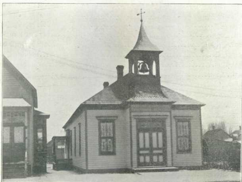
Deutsche Evangelische Immannuels-Kirche.