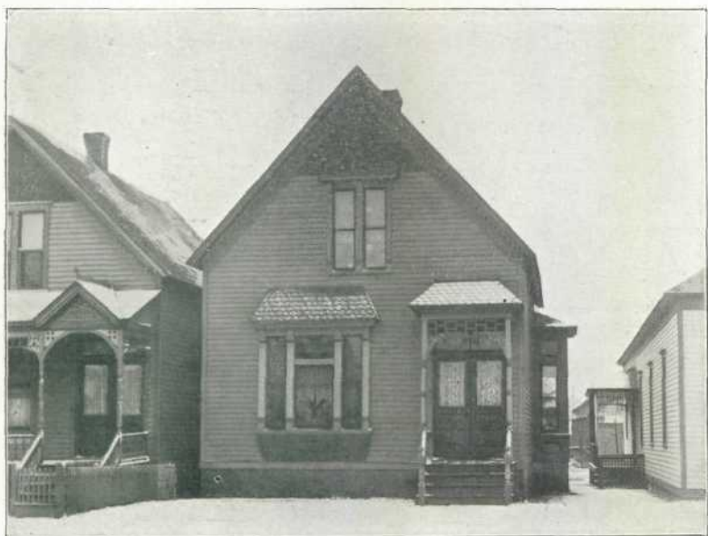
Pfarr-Haus der Deutschen Evangelischen Immanuels-Gemeinde.