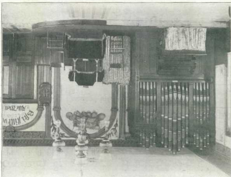
Weg und Wandel der deutschen Evangelischen Gemeinschaften.